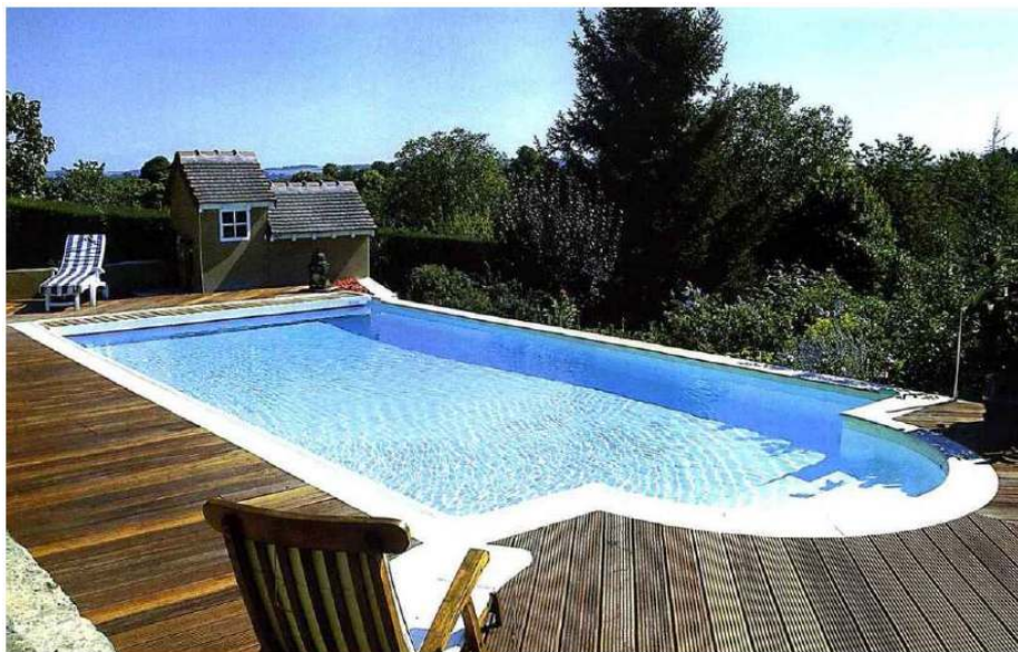
1- Cette vaste piscine, réalisée à l'aide de panneaux en polypropylène à coffrage perdu, domine l'ensemble du jardin. La douce clarté de la margelle contraste avec la chaleur du bois et fait agréablement ressortir les lignes pures et harmonieuses de ce bassin. Magiline