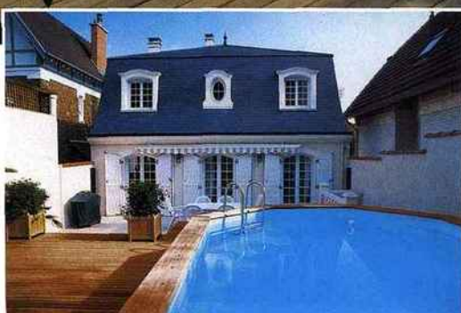
Sur une terrasse en bois, cette semi-enterrée à la forme octogonale est particulièrement intéressante et permet de faire de véritables longueurs. Piscinelle, piscine Rg.