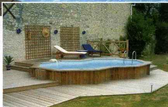
Cette piscine en bois semi-enterrée s'intègre parfaitement dans un décor de style. Sa forme géométrique et irrégulière crée l'originalité. Beaver Pool, piscine Short Twin.

sin de l'intrusion des débris végétaux et de la pelouse. Dans tous les cas, il est toujours plus agréable de poser ses pieds sur une surface solide plutôt que de se retrouver dans la pelouse. C'est également et surtout un espace de détente tout autour du bassin pour profiter du plan d'eau en toute saison. Elle doit par conséquent être aussi plane et lisse que possible pour un maximum de confort mais ne doit surtout pas être glissante. Dans ce domaine, deux matériaux