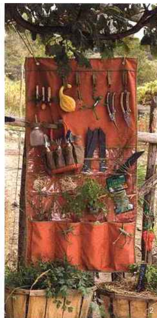
1 & 3. Ergonomie, puissance et légèreté sont les atouts de ces outils de coupe signés Fiskars. Ainsi le sécateur et le coupe-branches à crémaillère PowerGear (efficace respectivement sur

Dangereux par nature, le taille-haies ou la tronçonneuse sont des engins puissants et lourds à manipuler à deux mains avec la plus grande précaution. Les pièces