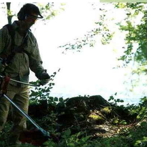
5 & 6. Dangereux, l'outillage électrique et thermique exige le port de vêtements de protection adéquats (lunettes, gants...). Les nouveaux modèles assurent un