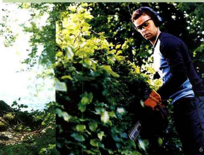
certain niveau de sécurité. Ici, le taille-haies thermique (HT2124T), léger et équilibré, est doté d'un arrêt synchronisé des lames afin de rendre inaccessible leur tranchant.