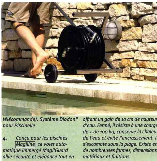
télécommande). Système Diodon™ pour Piscinelle

En Belgique, les aspects de sécurité de la vente et de l'installation de piscines privées sont réglementés par la loi du 9 février 1994 relative à la sécurité des produits et des services. Cette législation stipule clairement que « les produits (tels qu'une piscine privée) ne peuvent pas présenter de risques inacceptables dans des conditions d'utilisation normales ou raisonnablement prévisibles et qu'il convient, lors de l'évaluation, de tenir compte notamment des catégories d'utilisateurs se trouvant dans des conditions de risque, comme les enfants ». Les producteurs sont également obligés de mettre en garde les consommateurs et de les informer sur les risques inhérents au produit, lorsque ces risques ne sont pas immédiatement perceptibles sans un avertissement adéquat. Ainsi, le consommateur, informé et sensibilisé, peut