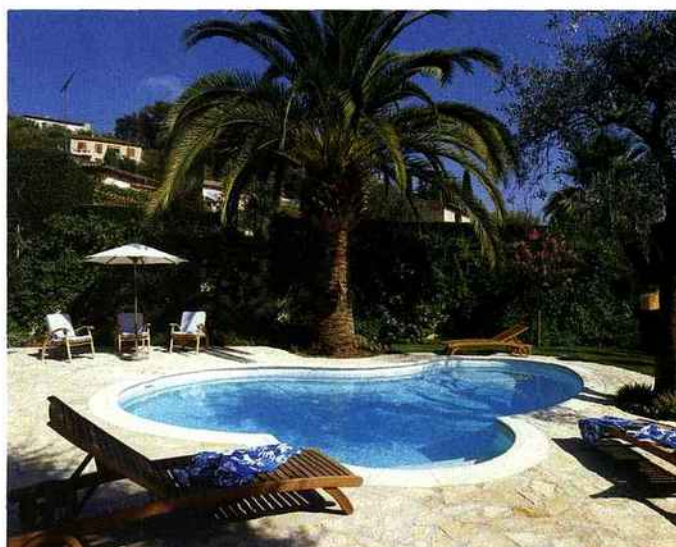
Les panneaux du kit sont assez souples pour permettre de créer de nombreux arrondis. Une piscine en forme de tête de Mickey? Le vœu est exaucé. Waterair.