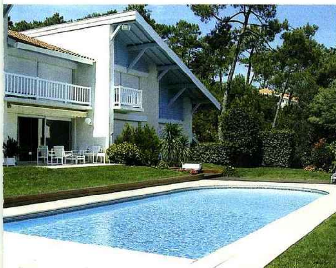
Le temps est à la baignade et au bronzage sur les transats. Les cigales chantent dans les pins, il fait beau. La vie s'écoule paisiblement. Magiline.