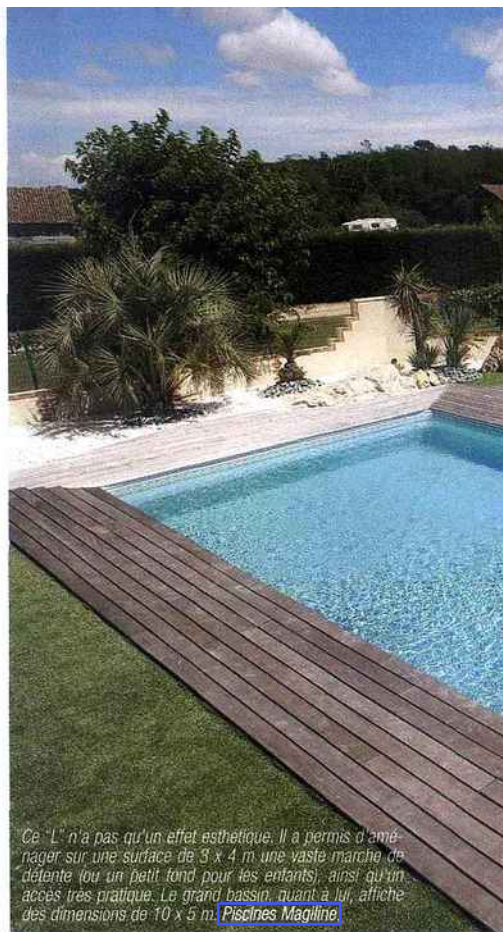
Ce "L" n'a pas qu'un effet esthétique. Il a permis d'aménager sur une surface de 3 x 4 m une vaste marche de détente (ou un petit fond pour les enfants), ainsi qu'un accès très pratique. Le grand bassin, quant à lui, affiche des dimensions de 10 x 5 m. Piscines Magiline

Très audacieuse, la forme de ce bassin miroir associe un rectangle, un carré dédié à l'escalier et un demi-cercle pour la plage immergée ! On remarque que la découpe de la plage bois a suivi ce principe fantaisique pour venir mourir sur le gazon. La couleur du revêtement en pâte de verre, également très audacieuse, rappelle avec une perfection troublante le bleu outremer de la méditerranée en août. plan. Piscines & Spas J. Hugory.