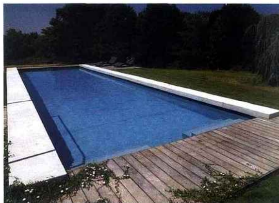
Ce fabricant propose des structures composées à 100% de matériau recyclé. Aujourd'hui 8 400 bouteilles de lait peuvent se transformer, grâce à la magie de l'industrie et du recyclage, en une piscine ovoïde de 8 x 4m ! Desjoyaux Piscines.