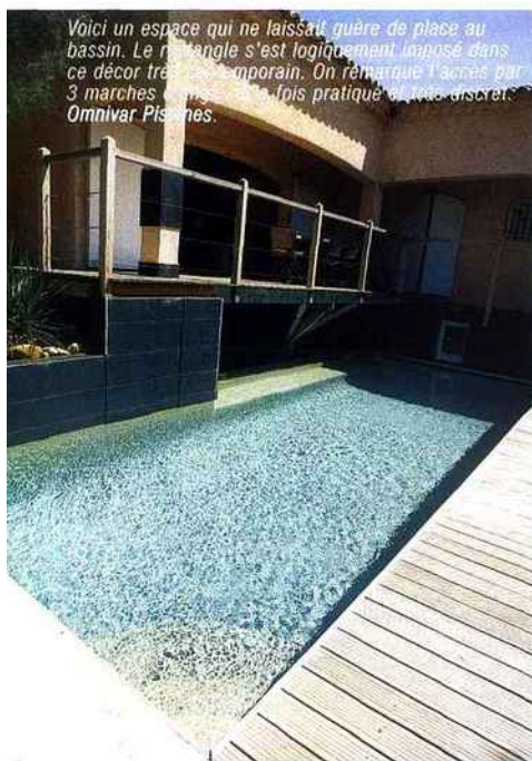
Voici un espace qui ne laissait guère de place au bassin. Le rectangle s'est logiquement imposé dans ce décor très contemporain. On remarque l'accès par 3 marches élargies, très pratique et très discret. Omnivar Piscines.