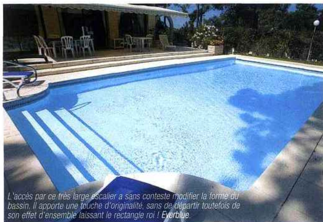
L'accès par ce très large escalier a sans conteste modifier la forme du bassin. Il apporte une touche d'originalité, sans de départir toutefois de son effet d'ensemble laissant le rectangle roi ! Everblue.

Avec des lignes aux géométries variables, il est possible de sortir du classique rectangle, sans pour autant se risquer aux formes libres réclamant le plus souvent un environnement fortement paysagé. Les formes en "L" sont les plus fréquentes, mais il est également possible d'associer lignes droites avec une ou deux courbes aux cintres propices à un débordement ou à un accès, quel qu'il soit.