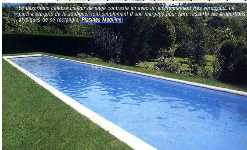
Le désormais célèbre couloir de nage contraste ici avec un environnement très verdoyant. Le parti a été pris de le souligner tout simplement d'une margelle pour faire ressortir les proportions atypiques de ce rectangle. Piscines Magiline