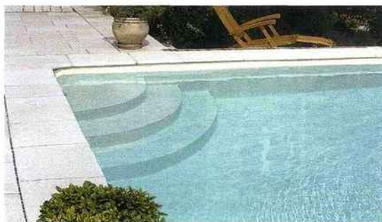
Piscine en kit dont la structure est issue de polypropylène à 80% recyclé. Qualipool de Magiline .