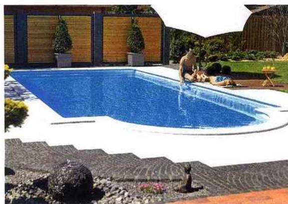
Cette piscine est réalisée avec des panneaux très performants de 0,50 par 1,50 m en polyéthylène recyclé. Faciles et légers (16 kg) à visser, ils permettent de construire une piscine à fond plat. RecyPool de Unipool.