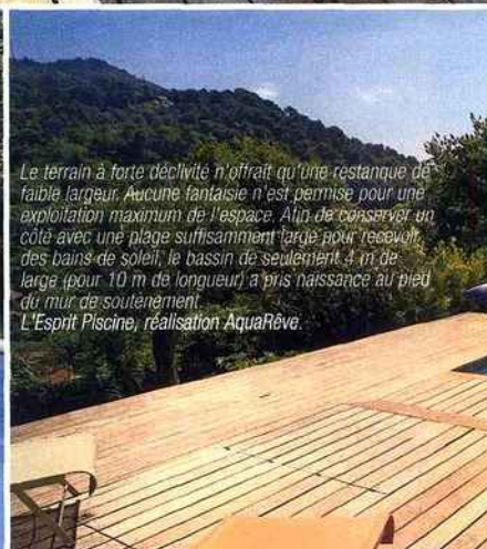
Le terrain à forte déclivité n'offrait qu'une restanque de faible largeur. Aucune fantaisie n'est permise pour une exploitation maximum de l'espace. Afin de conserver un côté avec une plage suffisamment large pour recevoir des baigneurs, le bassin de seulement 4 m de large (pour 10 m de longueur) a pris naissance au pied du mur de soutènement. L'Esprit Piscine, réalisation AquaRêve.