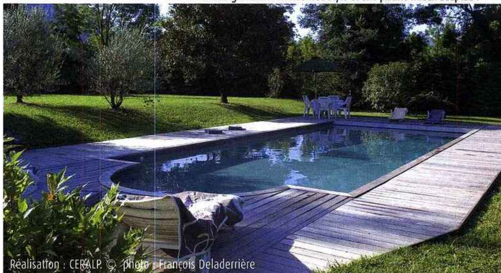
Réalisation : CERALP.

Carré Bleu : Piscine de 10 x 5 m, avec escalier roman, qui a retrouvé un nouveau look après avoir été rénovée. Les travaux de rénovation ont permis d'intégrer des équipements pour apporter plus de confort, avec entre autres : une pompe à chaleur et une couverture automatique immergée aux lames grises pour s'harmoniser au nouveau revêtement : une membrane armée gris foncé. Un nouveau style et une piscine mieux adaptée !