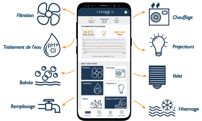
Connexion à distance grâce à l'application mobile

La solution iMAGI-X est constituée de capteurs et de sondes, d'un coffret de pilotage permettant de commander la pompe à chaleur, de systèmes de traitement et de filtration de l'eau, de diverses fonctionnalités CONFORT et également d'une application Internet pour accéder et gérer à distance tous les paramètres du bassin.